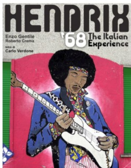
JIMI HENDRIX COVER

Janis Joplin e Jim Morrison, che come lui bruceranno rapidamente il loro mito tra alcol e droghe sull'altare della domanda lanciata dallo stesso Hendrix con il titolo del suo primo album: Are you experienced?